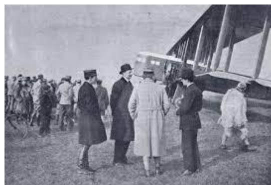
1 er mars 1920, première liaison aérienne commerciale Paris-Lyon-Marseille par avion Farman F-HMFU