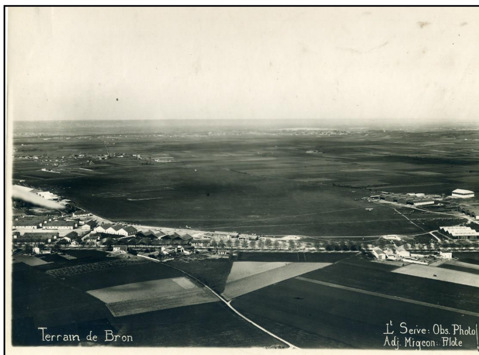
Le terrain d'aviation de Bron en 1920

1 er janvier 1920, à Bron, le 5 ème Groupement d'aviation d'observation constitué en 1919 devient le 5 ème Régiment Aérien d'Observation (RAO) qui préfigure le 35 ème Régiment d'Aviation d'Observation composé de six escadrilles, toutes progressivement équipées de Breguet XIV : Br 207, SPA-Bi 53, SAL 32, SAL 52, Br 243 et SAL 17.