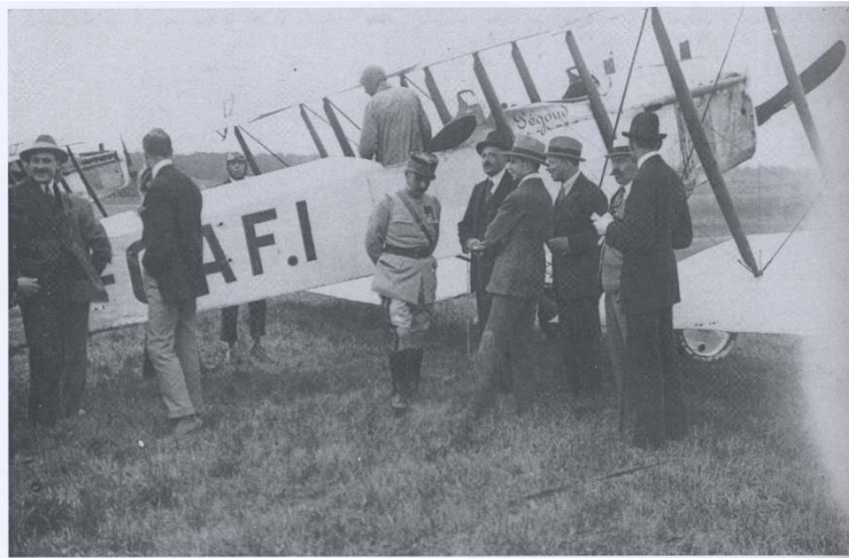
Les personnalités officielles devant le Dorand AR, F-CAFI de la Compagnie Aérienne Française