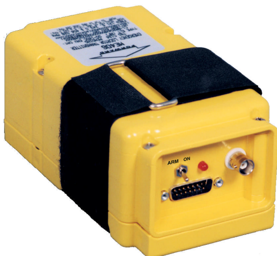
Balise Artex ME406