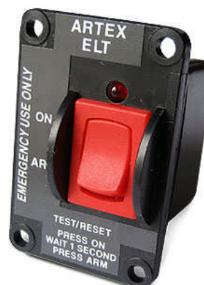
Platine de commande au tableau de bord

La balise Artex ME406 qui équipe la flotte des Ailes Lyonnaises est de type « ELT automatique » (Emergency Location Transmitter), plus particulièrement destinée aux aéronefs de l'aviation légère; elle est dotée d'un contacteur intégré (G-switch) qui déclenche son émission automatiquement lors d'un choc longitudinal de plus de 2.3 G.